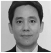
BK Cheon Chief Investment Officer DGB Life Insurance